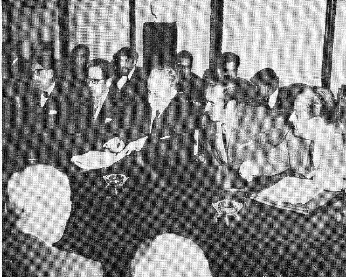
EL DIRECTOR DEL INSTITUTO CARO Y CUERVO ACEPTA LA ENTREGA DE LA CASA EN QUE NACIO EL INSIGNE FILOLOGO COLOMBIANO

Abierta la sesión, el Secretario encargado leyó la siguiente proposición firmada por varios académicos, la que, a petición del Dr. Bateman, fue aclamada: