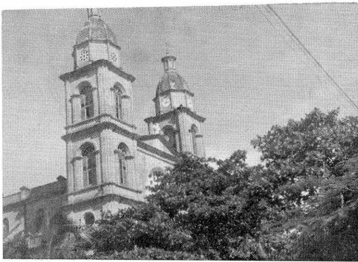
BARRANCABERMEJA: Torres de la catedral.

de calles pavimentadas y de construcciones que copian con fidelidad las de cálidas aldeas vecinas. La desarticulada situación social-económica de este Municipio, que depende en lo judicial de Ocaña, en lo administrativo de Cúcuta y en lo comercial de Bucaramanga, prueba que la actual división política del territorio colombiano no es funcional para algunas regiones y que, posiblemente, se justifican integraciones y redistribuciones, sin necesidad de crear nuevas entidades y burocracias departamentales.