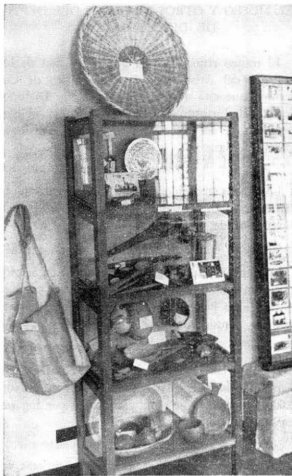
MUSEO ETNOGRAFICO DE YERBABUENA